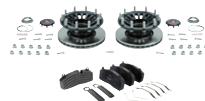
Kit intégral SAF