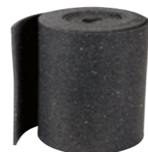
Tapis antidérapant TRP