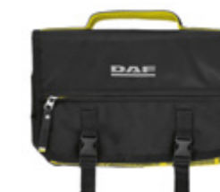
Trousse de toilette

Réf: M004556 Peut être posée debout ou accrochée à l'aide du crochet métallique, plusieurs poches internes