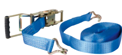
Sangles cliquets inversés TRP