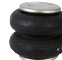
Coussin de relevage