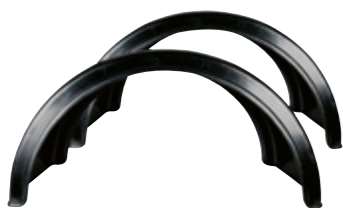
Aile de remorque HL31