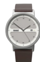
Montre classique homme

Réf: M004578 Bracelet en cuir marron, boîtier couronne et boucle en acier inoxydable argenté. Taille du boîtier: 40 MM