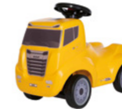
Camion porteur XG+ pour enfant

Réf: M004609 Convient aux enfants âgés de 18 mois à 4 ans, max. 30 KG