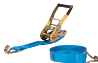
Sangles cliquets standards TRP

Réf: 0888949 9M, 5 T, cliquets standards