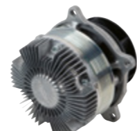
Pompe à eau