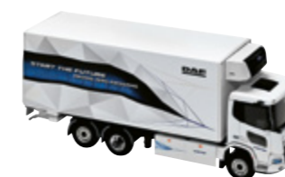
Miniature XD électrique