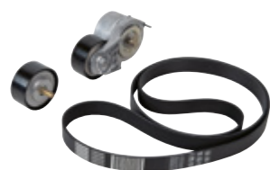
Kit courroie et galets