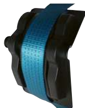
Cornière plastique TRP