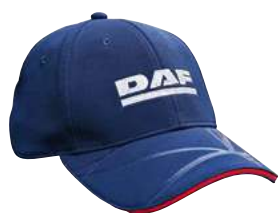
Casquette DAF MY-25

Réf: M004652 Sangle réglable, 100 % polyester