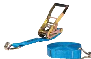
Sangles cliquets standards TRP