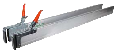
Barre de retenue TRP