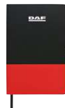
Carnet de notes DAF MY-25

Réf: M004622 Format A5, boucle pour stylo et marque-page intégrés