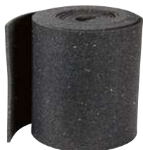
Tapis antidérapant TRP