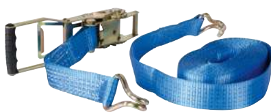
Sangles cliquets inversés TRP