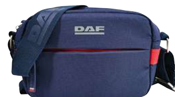
Sacoche DAF MY-25

Réf: M004656 Taille: 20 x 14 x 9CM, bandoulière réglable 100 % polyester